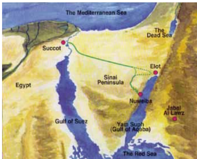
Den gröna linjen anger den föreslagna vägen ut ur Egypten (s. 182 i Möllers bok).

att Israels barn har gått vilse i landet och blivit instängda i öknen” (2 Mos. 14:2-3). I stället för att fortsätta norr om Aqabavikens nordspets skulle de vända om och gå ner mot havet (Jam suf). Enda vägen ner mot havet var enligt Möller Wadi Watir, en dalgång mellan höga berg som ledde ner till Nuweiba-näset, ett slättland som man bara kan lämna genom att ta samma väg tillbaka. Enligt Möller bör Pi-hachiro t syfta på mynningen från Wadi Watir ut till Nuweiba-näset ( Pi betyder ”mun, mynning”), Migdol (”torn”) syfta på ett vaktorn på en av bergstopparna vid dalmynningen och Baal-sefon syfta på en kultplats för Baalsdyrkan på andra sidan havet mitt emot Nuweiba.